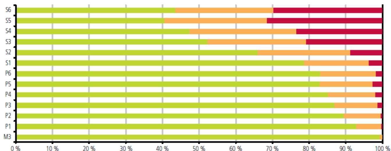
Figure 10.1 : Rythmes scolaires individuels dans l'enseignement ordinaire, Communauté française, 2017-2018

M=Enseignement maternel; P=Enseignement primaire ; S=Enseignement secondaire légende : vert=à l'heure; orange=retard d'un an; violet=retard de 2 ans et plus